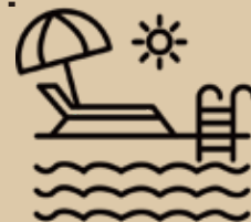
ウォーターライダー