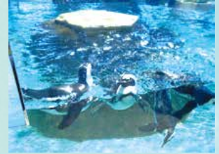
ペンギンさん、気持ちよさそうでした！