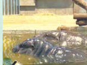
カバの親子はとっても仲よし♡昨年生まれた小カバちゃん、今は60kg越えと随分成長していました。