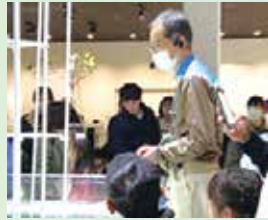
テッポウウオは獲物を狙って3メートルも水鉄砲が飛ばせるんです。すごい！