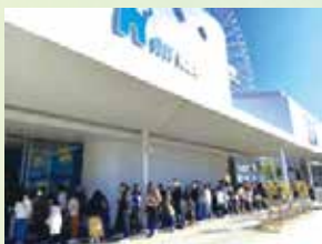
寒い中お並びいただきました <m(_ _)m>

当日、車で参加された方の中には1時間以上前に到着され8時の駐車場オープンをお待ちいただくなど全体に時間に余裕を持って集合してくださったので、通常オープンまでの限られた時間ではありましたが、テッポウウオの餌付けの実演やカバの親子など充分にお楽しみいただけました。寒い中、早朝からお並びいただいたみなさま、ありがとうございました。