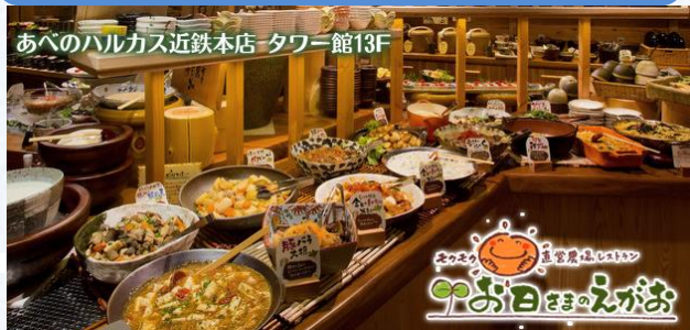
モクモク直営農場レストラン

普段は決して入ることができないバックヤードを アテンドスタッフが90分たっぷりご案内! もちろん展望台のフリータイムもあります!