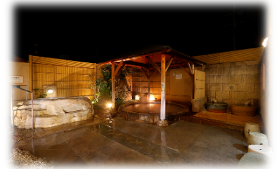
風の湯 河内長野店 河内長野市上原西町15-1

問題: 百舌鳥古市古墳群を世界文化遺産登録に向け地元の機運醸成のため、羽曳野市、藤井寺市内で活動する団体が発起人となり、立ち上げた団体の名称は?