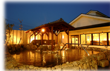
八尾おゆば 八尾市柏村町2-65-1

おゆば・風の湯入浴ご招待券(ペア)を (八尾・万博) (河内長野・新石切) クイズに答えてもらっちゃおう!!